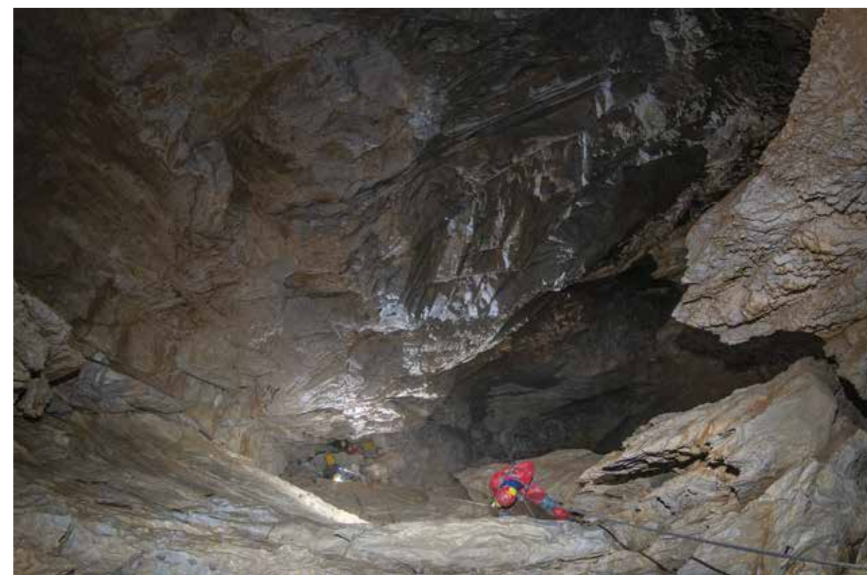
LA BUCA DELL' ARIA GHIACCIA, COME TUTTE LE GROTTA DI QUESTA VALLE SI APPROFONDISCE CON VERTICALI CHE POSSONO ESSERE ANCHE MOLTO PROFONDE

ACQUA - L'acqua che scorre in questa grotta riemerge alle sorgenti di Equi Terme.