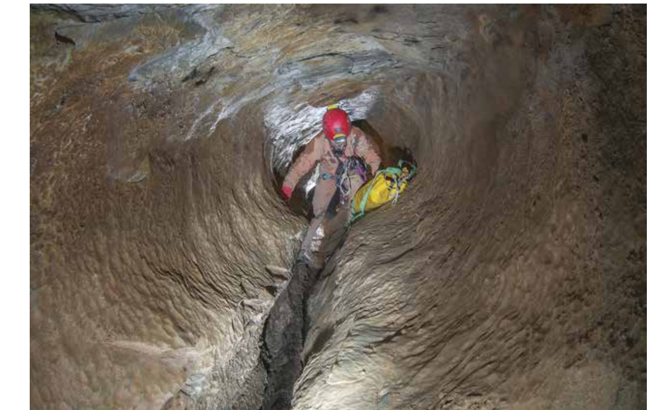
UNA CONDOTTA FREATICA IN CUI L'ACQUA SCORREVA A PRESSIONE. SUCCESSIVAMENTE IL LIVELLO DELL'ACQUA SI E' DRASTICAMENTE RIDOTTO CREANDO L' APPROFONDIMENTO VERTICALE