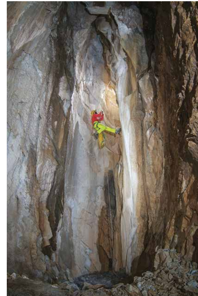
ALLA BASE DI QUESTO POZZETTO, VICINO ALL' INGRESSO GLI STRETTI AMBIENTI DELLA GROTTA BLOCCARONO LE PRIME ESPLORAZIONI