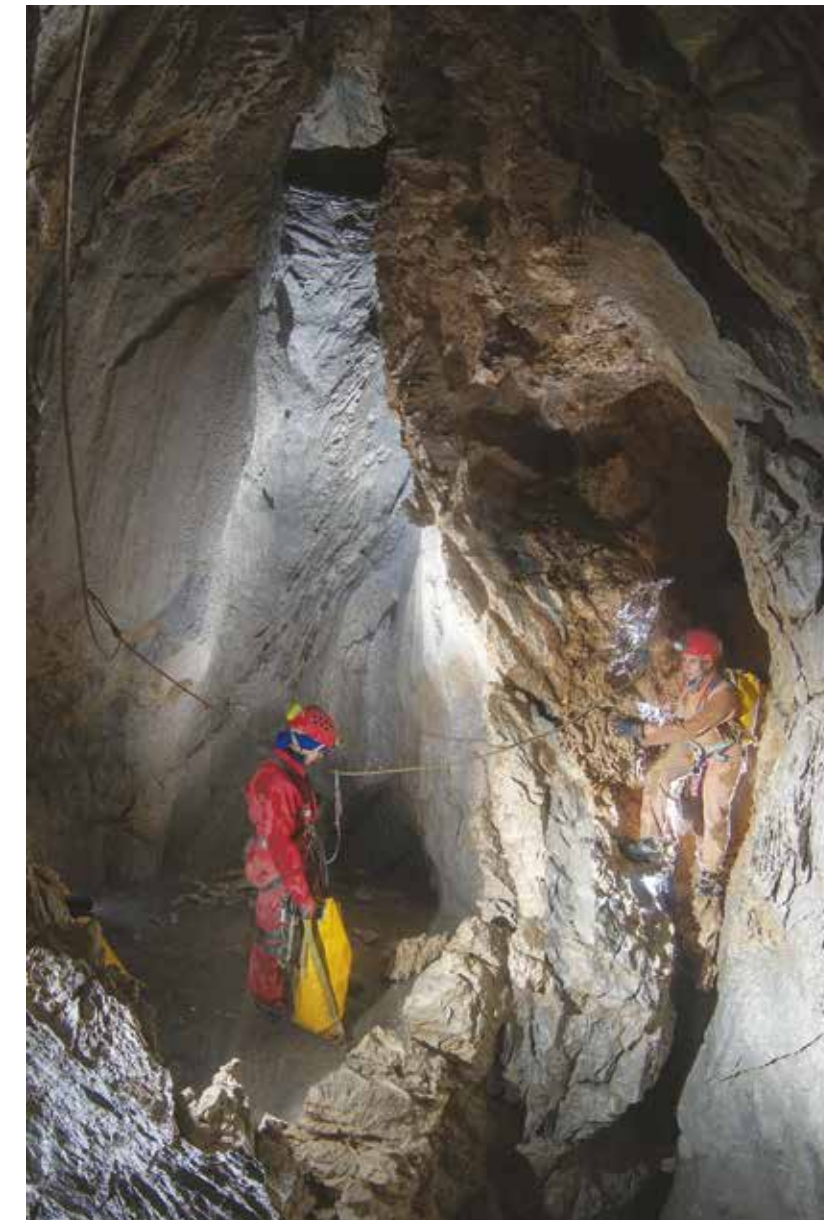
LA CASATELLA A -100 m LUNGO LA VIA DI DISCESA