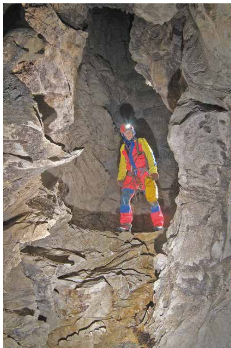
PERESTROIKA SI SVILUPPA PREVALENTEMENTE CON PROFONDI POZZI VERTICALI INTERVALLATI DA BREVI TRATTI ORIZZONTALI. UN PIANO DI BREVI MA AMPIE GALLERIE FREATICHE SI SVILUPPA TRA LE QUOTE -700m e -900m

ACQUA - L'acqua che scorre in questa grotta riemerge alla sorgente di Equi Terme.