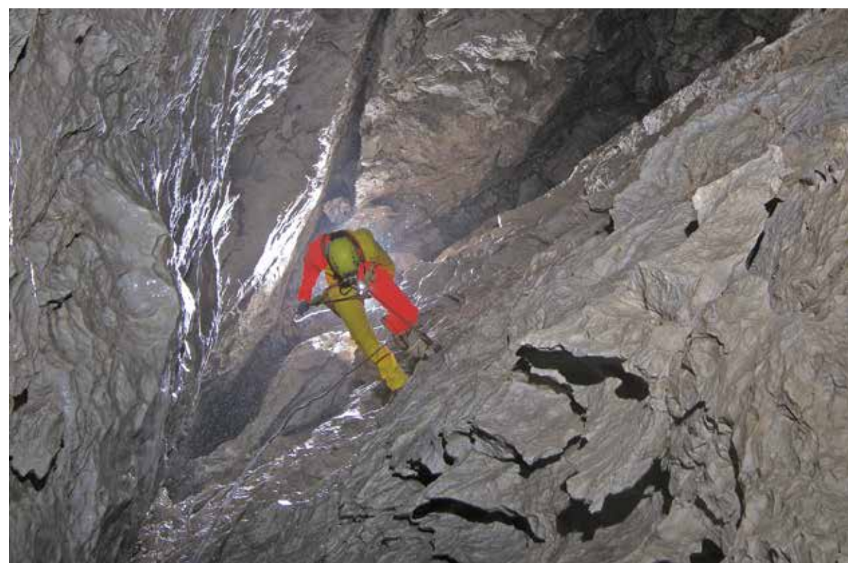
I POZZI DELL' ABISSO PERESTROIKA, BENCHÉ MENO AMPI DI QUELLI DI ALTRI ABISSI DELLA CARCARAIA, PORTANO COMUNQUE ALLA PROFONDITÀ NOTEVOLE DI -1135m